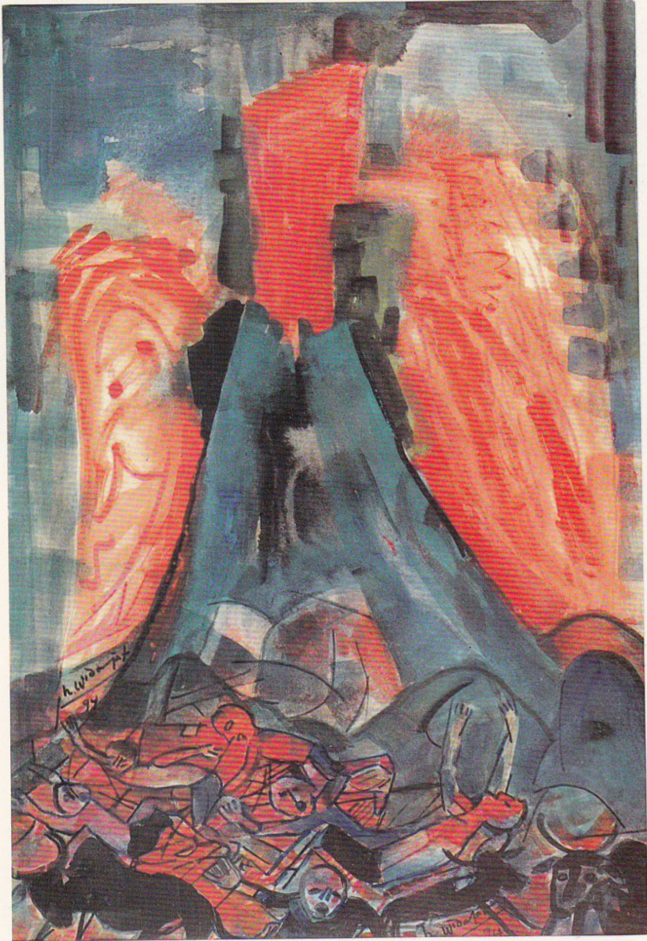
Tgl 22 Nop 1994 hari Selasa Kliwon Merapi meletus 70 x 98 Cm / Cat air di atas kertas / 1994